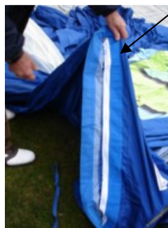
Le gonflage commence